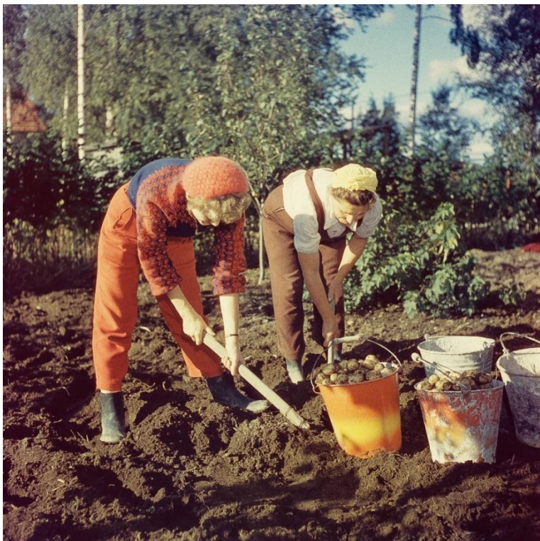
Nainen korjaa perunasatoa anoppinsa kanssa perunamaalla.

Helsinki, 1950-luku