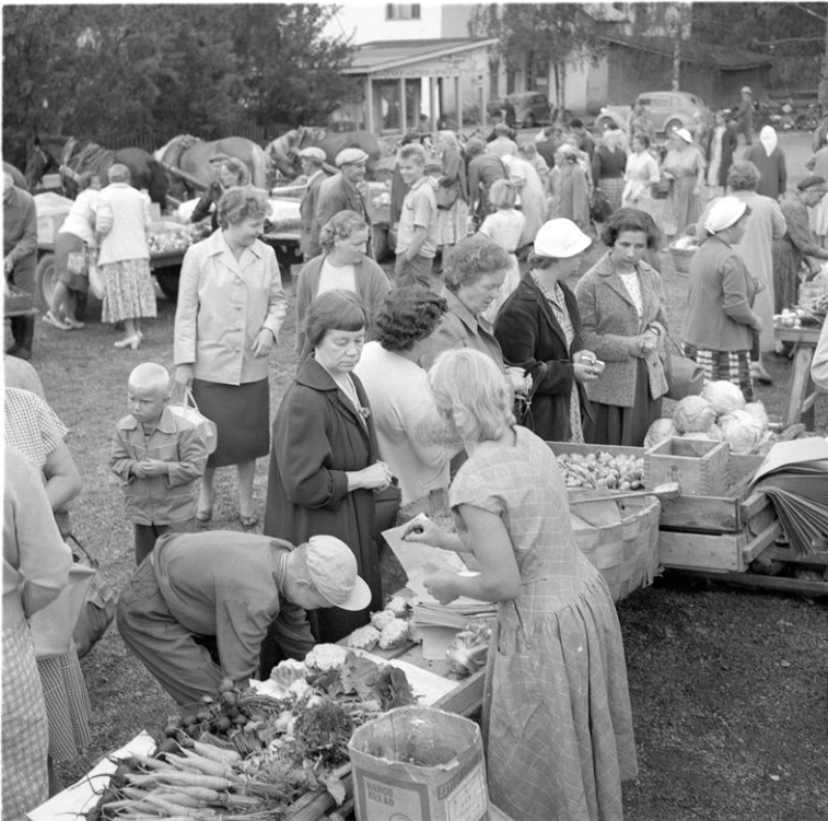
Imatran torilla; juureksia tarjolla. Imatra, 1957

Alanko, Anna-Liisa: Maan korvessa, Ilias 2003 Arvily: Kotoa ja kaukaa, Otava 1947 Arvoituksia, toim. Virtanen, Leea et al., SKS 1977 Happonen, Leo: Joka pojan ja tytön maatalousopas, Otava, 2. p., 1959 Sanat särpimen kanssa : sananparsia Pohjois-Karjalan eri pitäjistä, 2019